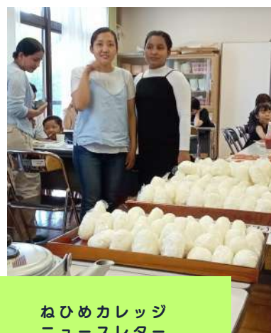
ねひめカレッジ ニュースレター